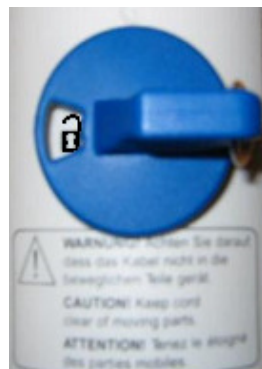
Deaktivierung der Sperre