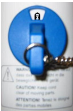
Aktivierung der Sperre

Durch die Aktivierung der Sperre an der Personaltastatur werden alle Funktionen des Bettes gesperrt.